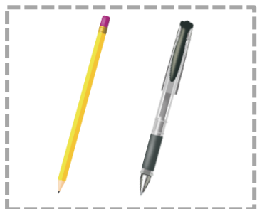
黑色 2B 軟心鉛筆、 黑色墨水的筆